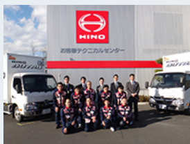
お客様テクニカルセンターにて受講者集合写真