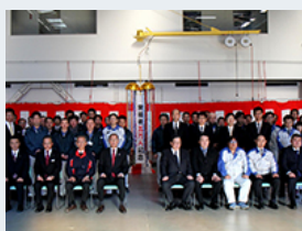
来場5万人目のヒューテックノオリン様を招いての記念式典

主としてJR東日本の駅構内にある店舗への商品配送業務を担う同社は、エコドライブ活動を推進しています。日野自動車の「省燃費運転講習」には積極的に参加しており、2006年度からいままでの受講者は累計で160人にのびります。